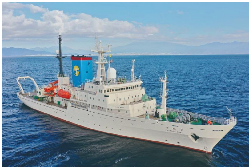
(写真1) 学術研究船「白鳳丸」

※2 海底電位磁力計 (OBEM: Ocean Bottom Electromagnetometer) : 海底地震計と同様、船舶により海底に設置し、一定期間磁場及び電場を測定する。取得した磁場及び電場データから海底下の電気の流れやすさを可視化し、流体の分布を把握することができる。