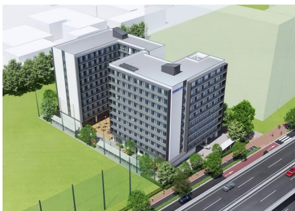
【完成予想図】上空から見た混住寮

本事業におけるBTO（Build Transfer Operate）方式とは、民間事業者が大学施設の建設を行い、完成後に施設の所有権を大学に移転し、民間事業者が施設の管理・運営を行う事業方式のこと。