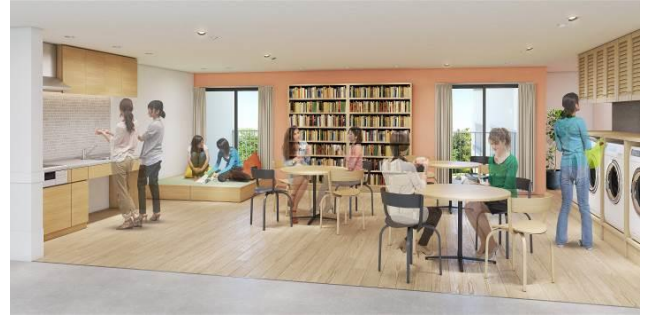
【交流スペース】 2～10階 寮生が歓談する様子