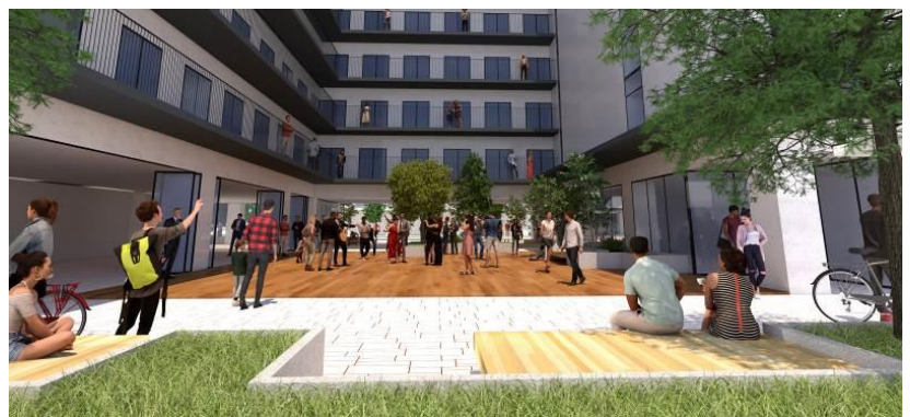
【「コミュニティプラザ」】 見通しの良い開放的なスペース