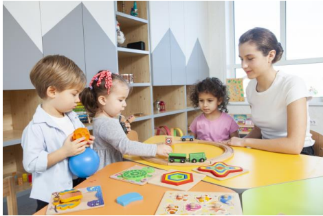
【「プレイルーム」(イメージ)】 10階 「ファミリーフロア」内 子供の遊び場スペース

混住寮は、2棟（東棟・西棟）からなり、地上10階建て、総戸数約350戸を予定しています。2階から9階までを寮生のフロアとし、9階の一部には防音扉で分けられた研究者対象の住戸を用意します。また、10階は外国人研究者等の家族での居住を想定した「ファミリーフロア」とし、子どもが遊べるスペースとして「プレイルーム」を設置。各階の中央部には、交流スペースを設け、居住者同士のコミュニケーションの醸成を支援します。