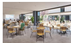
【1階】扉を開放することで中庭と一体となる多目的室

本事業は、東京海洋大学が大和ハウス工業を代表とする、現代建築研究所、大和ライフネクスト、芙蓉総合リースで構成されるグループと連携し、海洋分野における産官学リーダーを育成する国際混住寮を整備することで、国際的な教育・研究環境の向上を目指す事業です。